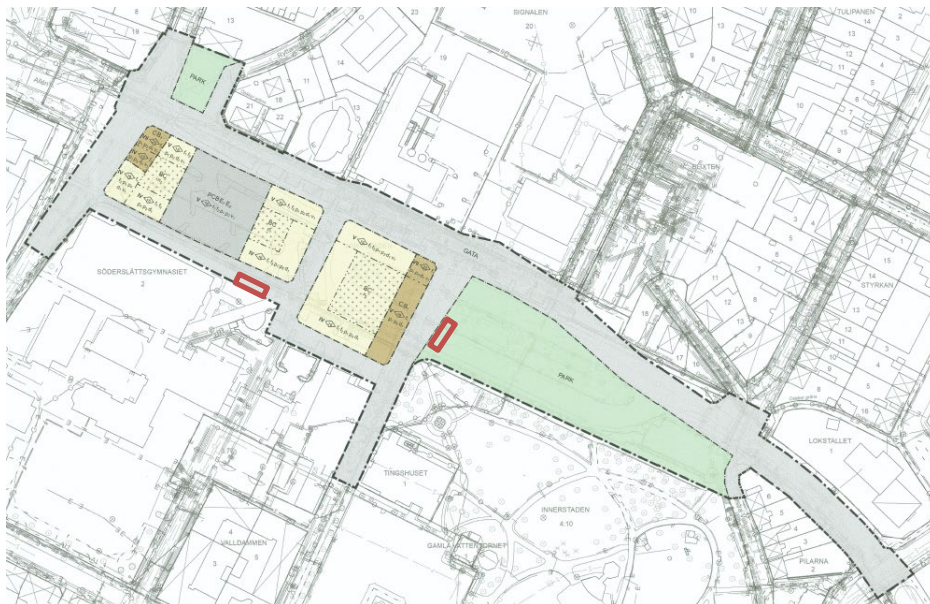
DP 243 Plankarta. Markerade områden i rött utgör aktuellt planområde.

För området gäller DP 243 Innerstaden 3:77 m.fl. "Övre och stadsparken". Aktuellt område är planlagt som allmän plats, GATA och PARK. Planförslaget ersätter de delar av DP 243 som berörs.