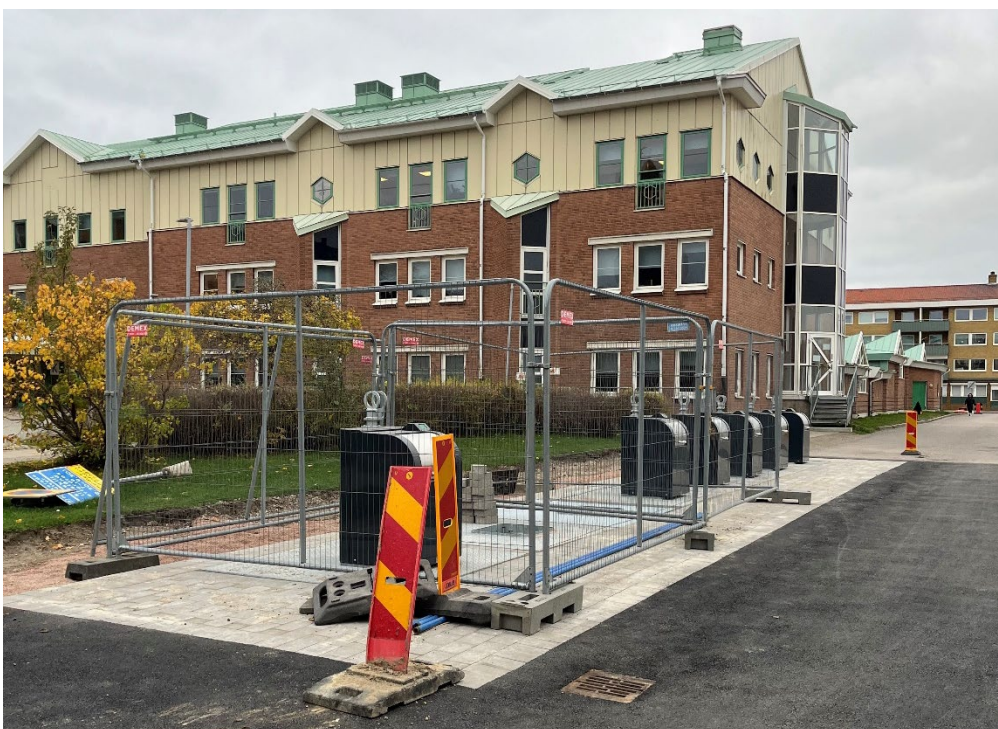
UWS vid Djäknegatan