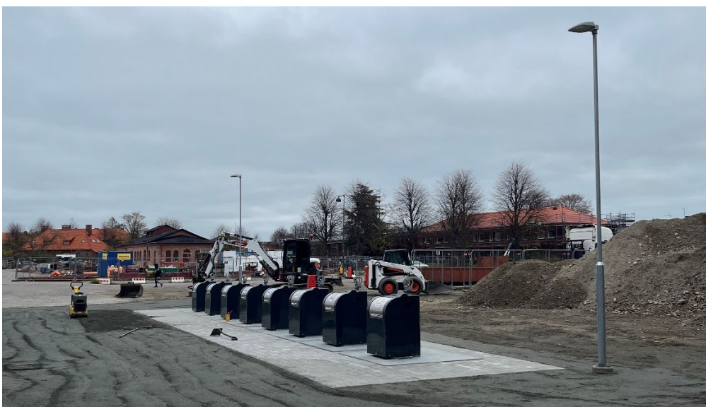
UWS vid Astrid Lindgrens Allé

Genomförandetid Genomförandetiden är 5 år från den dag planen vinner laga kraft.