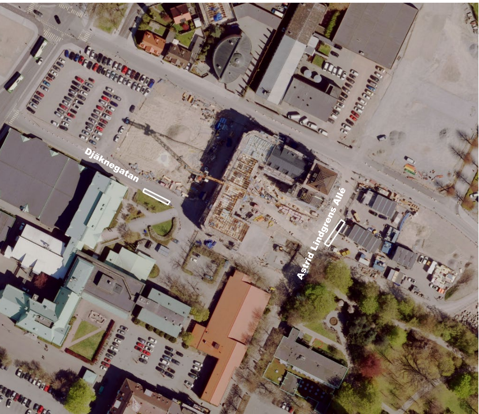
Planområdet markerat i vitt på flygfoto och består av två områden.