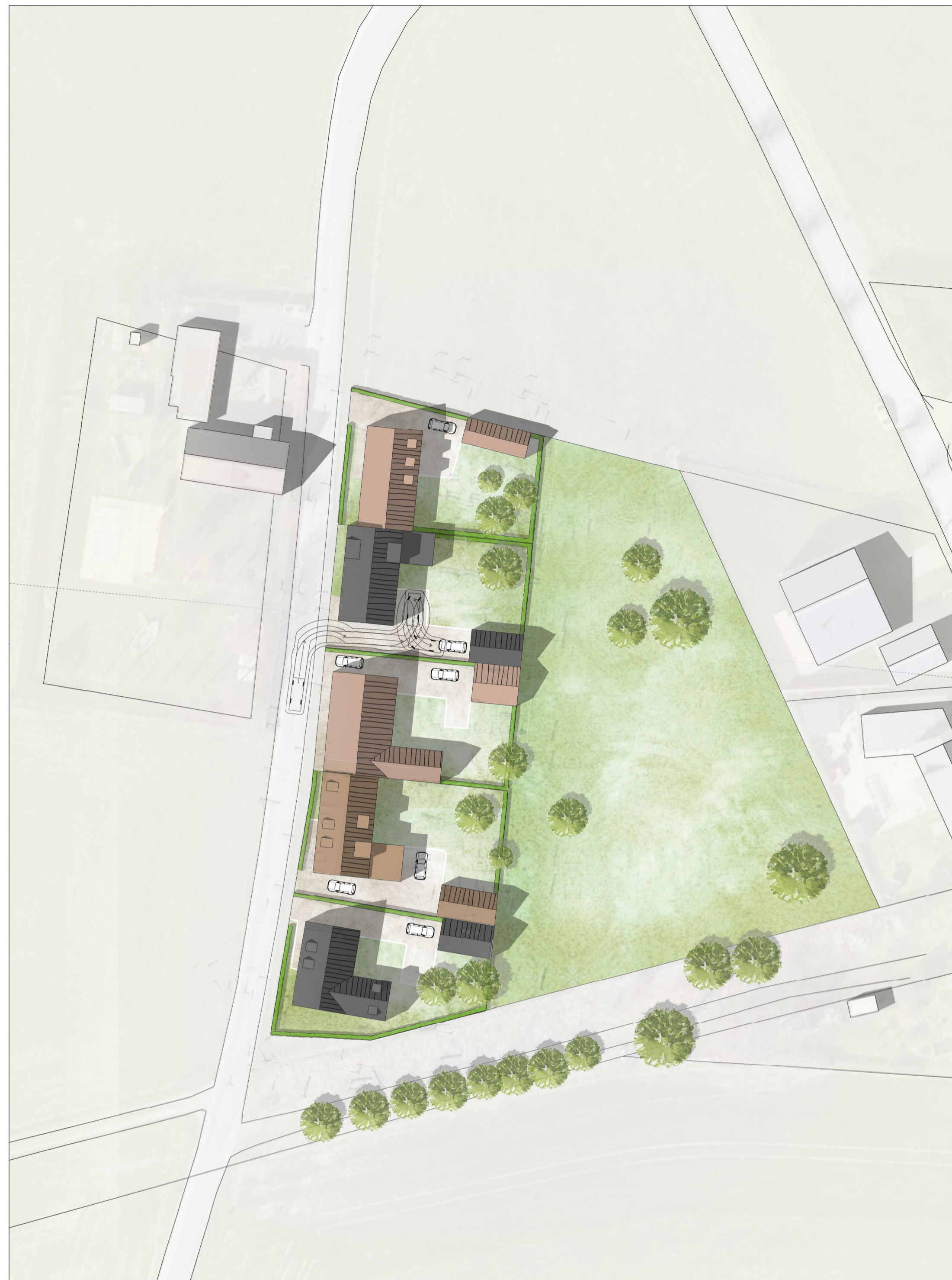
ILLUSTRATION 0 12,5 25 50 Meter SKALA 1:500 (A1)