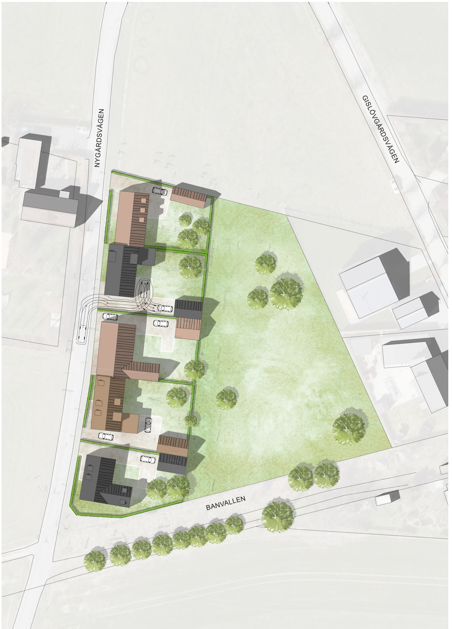
Illustrationsplanen visar ett möjligt genomförande av detaljplanen.