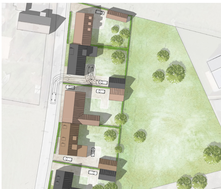
Illustrationsplanen visar hur utfarterna kan läggas intill varandra och hur vändmöjligheter kan lösas inom den egna fastigheten.

I illustrationsplanen visas hur utfarterna kan förläggas intill varandra, för att begränsa det totala antalet, och hur vändmöjligheter kan lösas inom den egna fastigheten. De nya in- och utfarterna kräver anslutningstillstånd från Trafikverket som i den processen bland annat bevakar utfarternas placering samt vändmöjligheter inom fastigheten.