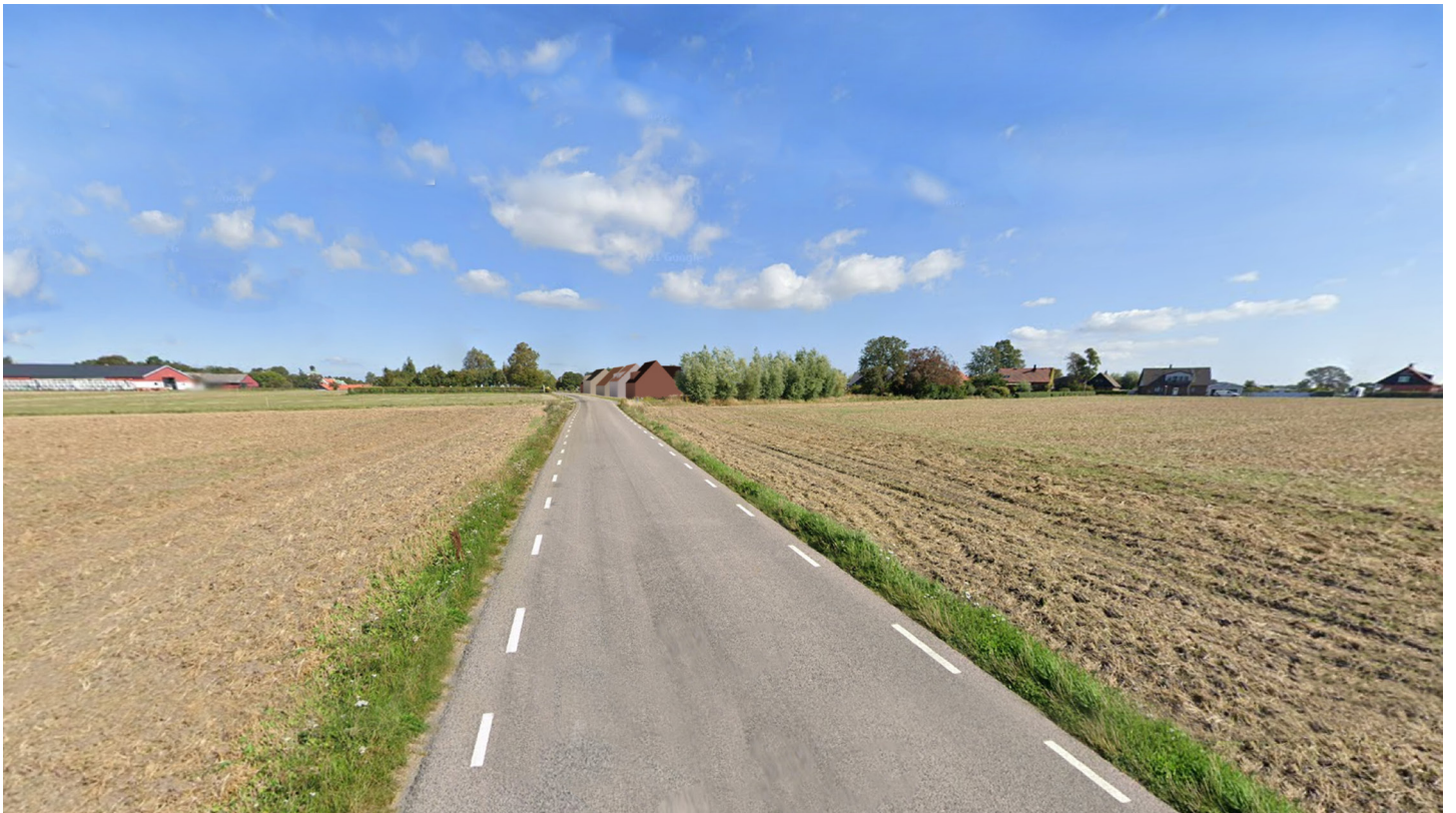
Fotomontaget visar den södra delen av Gislövs by efter planförslagets genomförande, betraktat söderifrån från Gislövgårdsvägen.