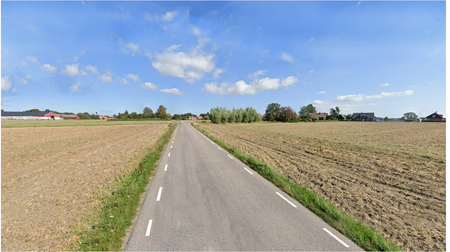
Fotot visar den södra delen av Gislövs by betraktat söderifrån från Gislövgårdsvägen.