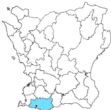
Figur 1. Skåne. Trelleborg kommun markerat med blått, utredningsområdets lokalisering markerat med svart punkt.