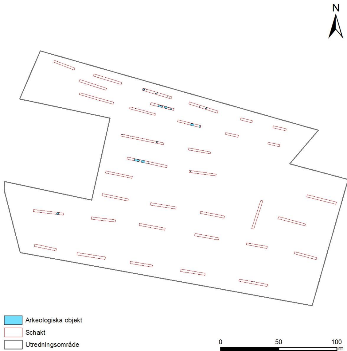
Figur 4. Plan över utredningsområdet. Sökschakt och arkeologiska lämningar markerade.