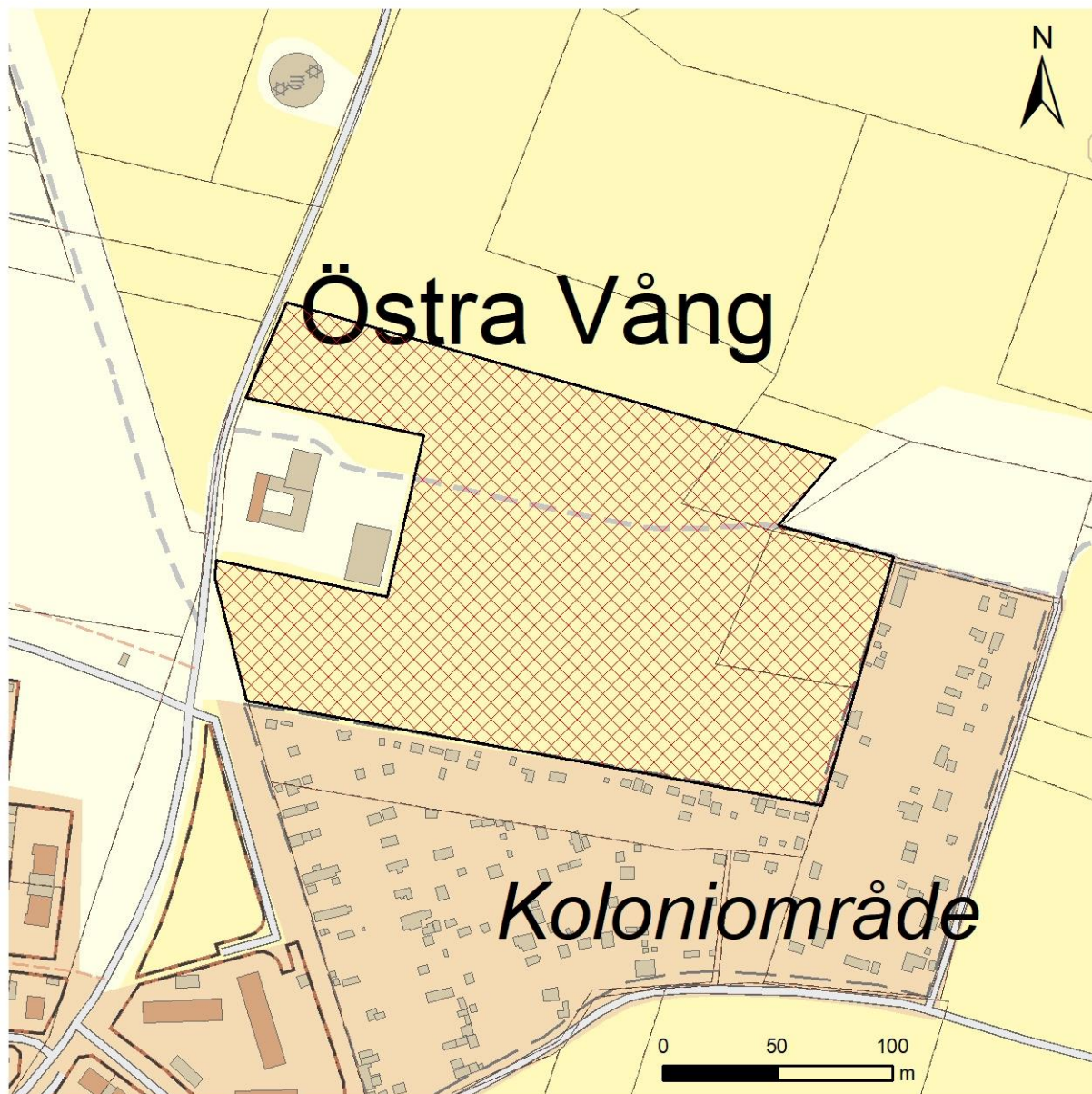
Figur 3. Fastighetskartan. Utredningsområdet markerat med röd skraffering.