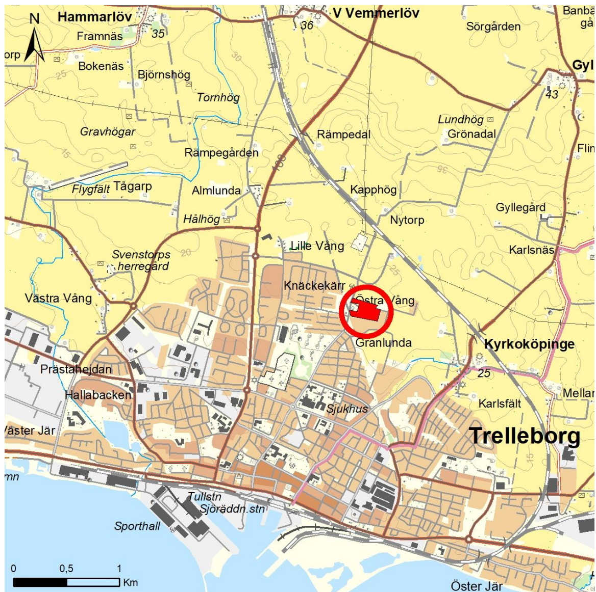
Figur 2. Terrängkartan. Utredningsområdets lokalisering i Trelleborg markerat med röd cirkel.