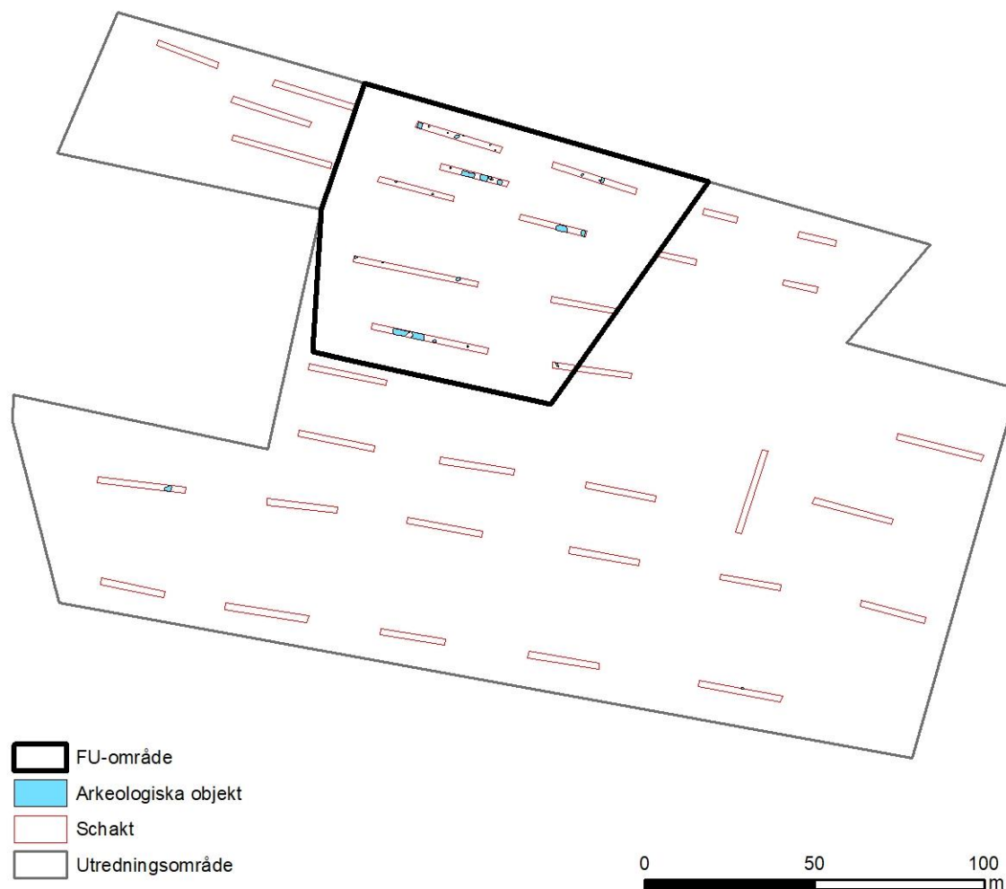
Figur 5. Plan över utredningsområdet. Sökschakt, arkeologiska lämningar och föreslaget förundersökningsområde markerat.