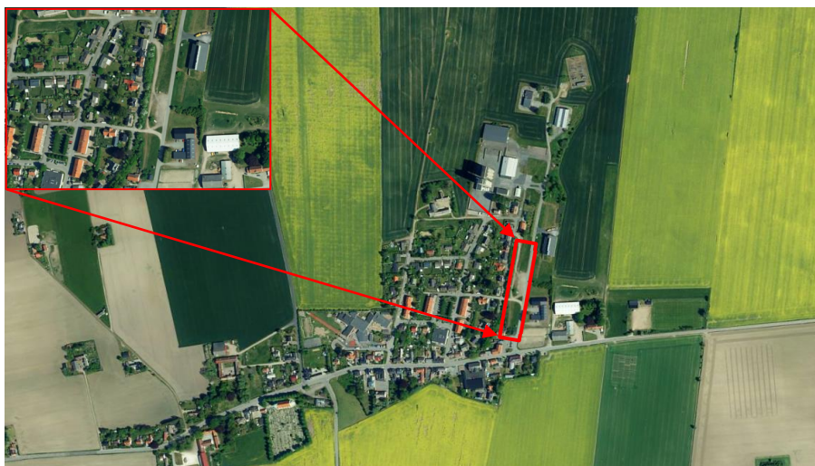
Figur 1. Översiktsbild över Klagstorps tätort med läget för Klagstorp 7:53 inom rött.

Fastighet/Område Trelleborg, Klagstorp 7:53. Läge och undersökningsområde, se nedan.