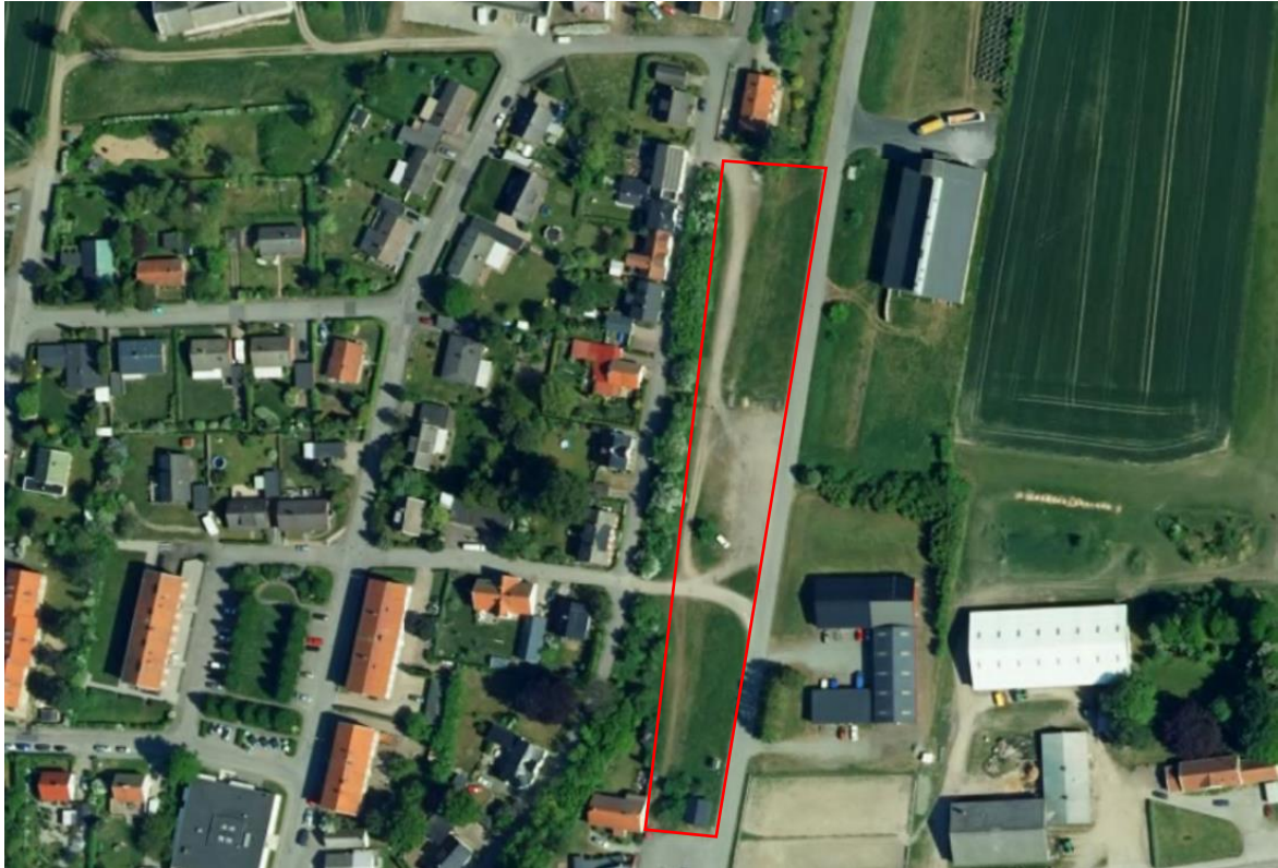
Figur 8.1. Ungefär nutid. Flygfotografering med markerat undersökningsområde.