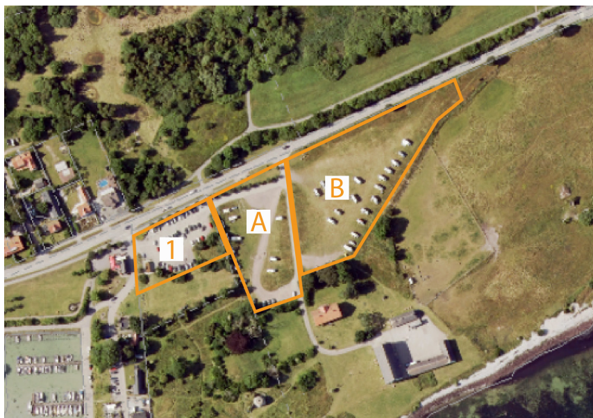
Parkering för Smygehuk uppdelat i tre områden, område 1, område A och område B.

En effektiv och ordnad parkeringsplats till besöksmålet Smygehuk säkerställer tillgängligheten till området. Avgränsningen av planområdet grundar sig på naturliga förhållanden och tidigare sökta dispenser för strandskyddet. Området kantas av buskage, träd och höjdskillnader. Platsen samspelar med besöksmålets olika destinationer så som hamnen och Köpmansmagasinet.