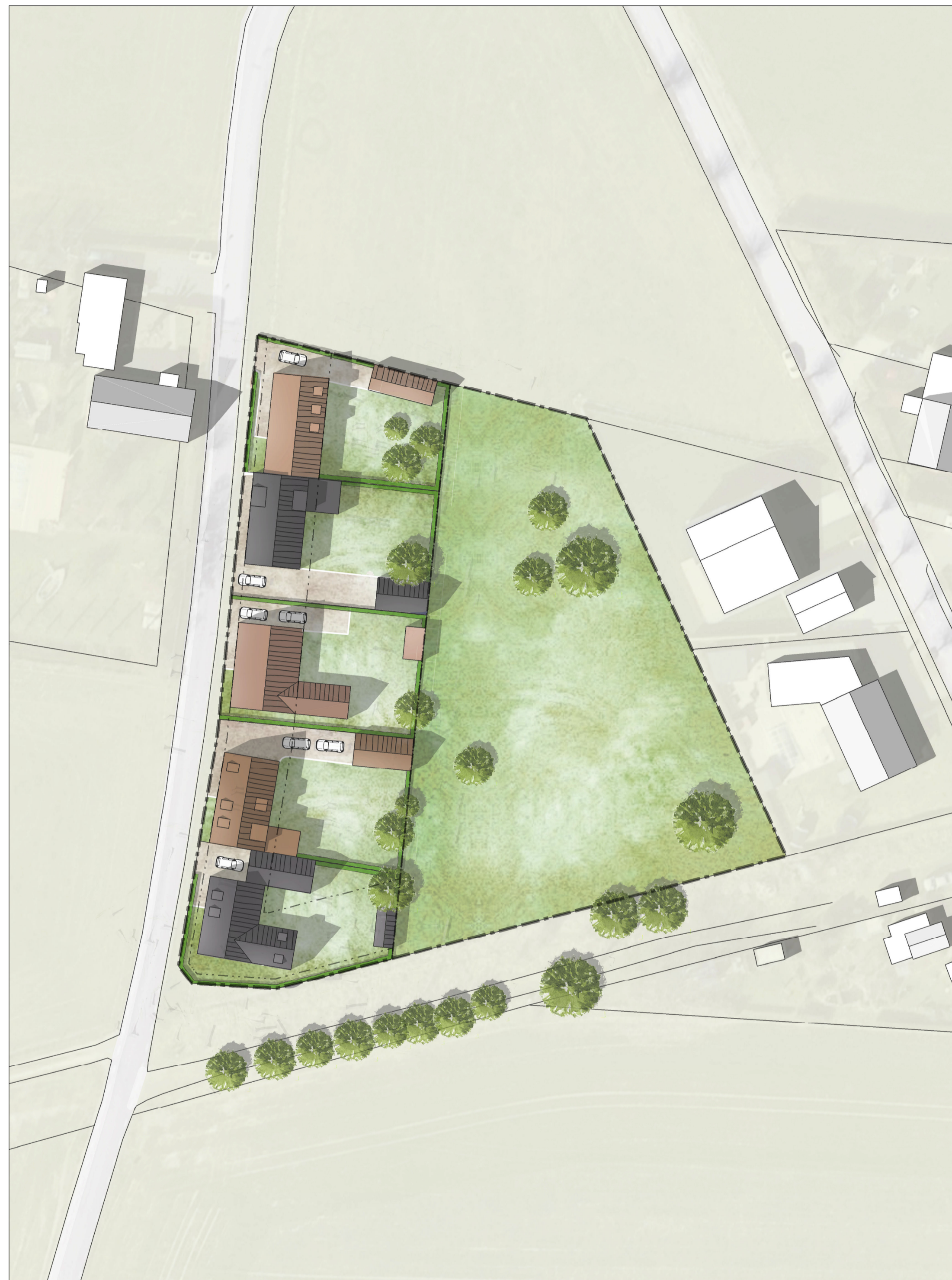
ILLUSTRATION 0 12,5 25 50 Meter SKALA 1:500 (A1)