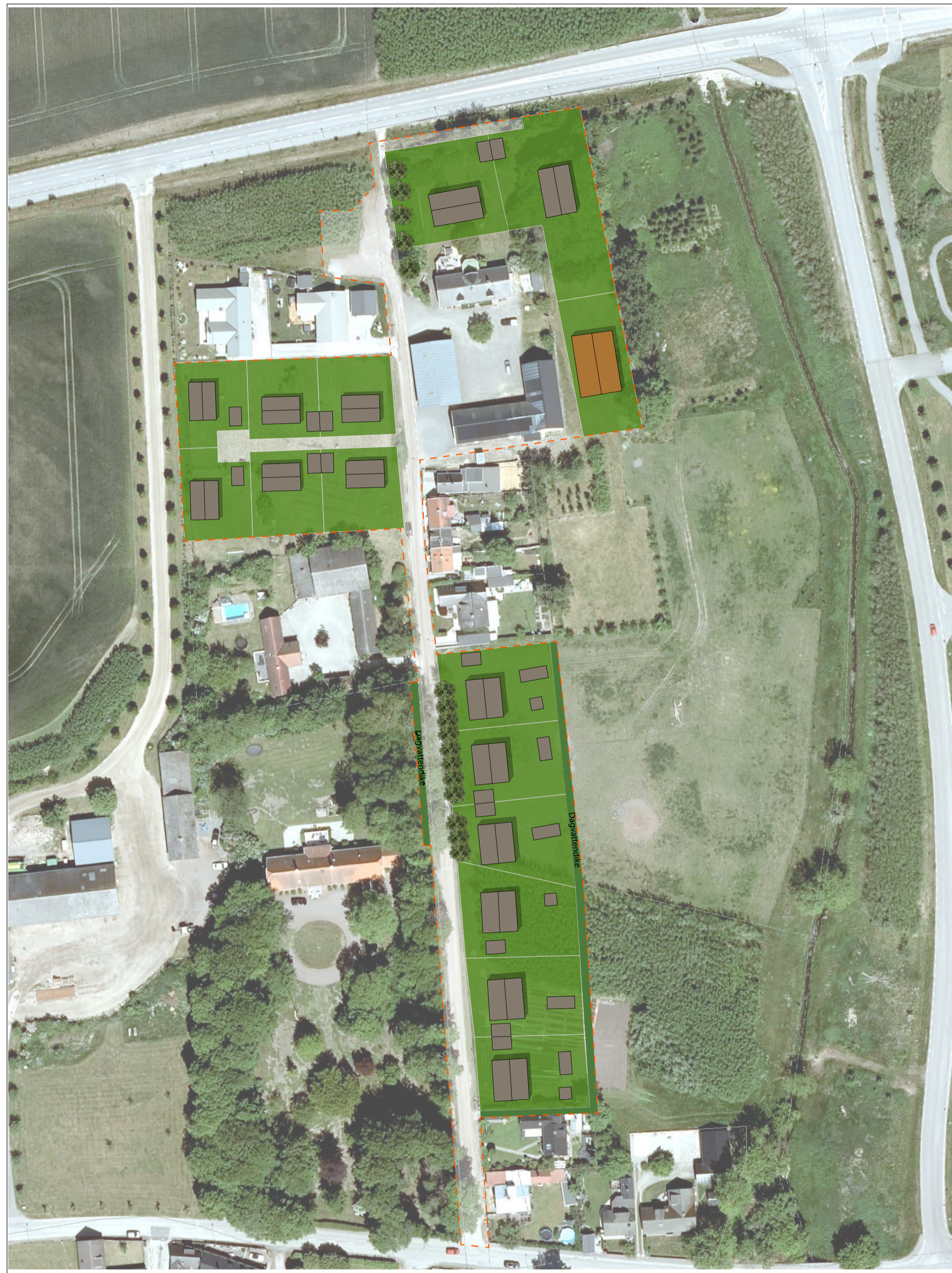
ILLUSTRATION SKALA 1:1000 (A1) VISAR ETT MÖJLIGT UTBYGGNADSNÄMNING